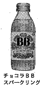
チョコラBB スパークリング