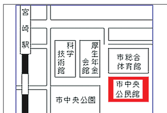
宮崎市中央公民館 住所 宮崎市宮崎駅東1丁目2番地7号