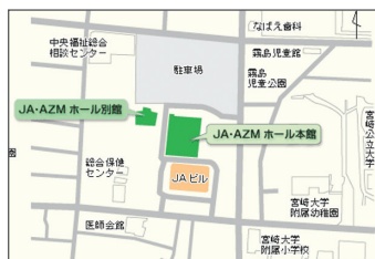
JA・AZM ホール 住所 宮崎市霧島1丁目1番地1号